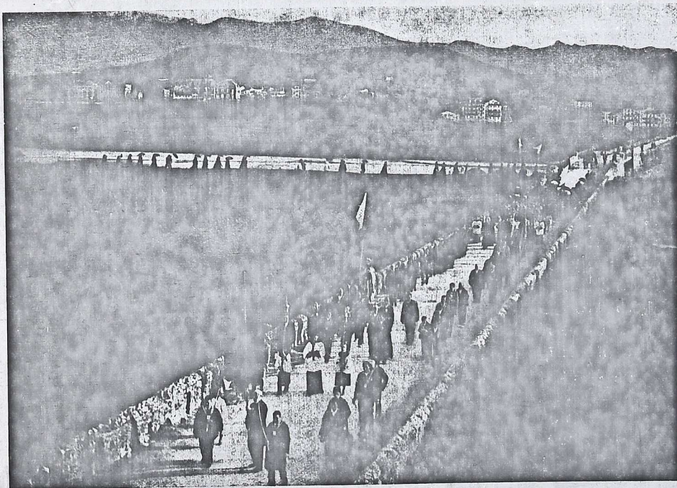
Procesión por los campos de Fuenterrabía