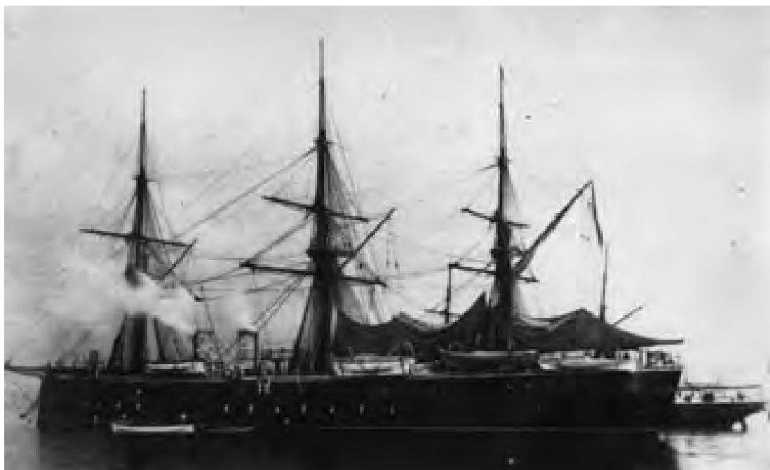
Del libro Buques de Vapor de la Armada Española. Del Vapor de Ruedas a la Fragata Acorazada, 1834-1885