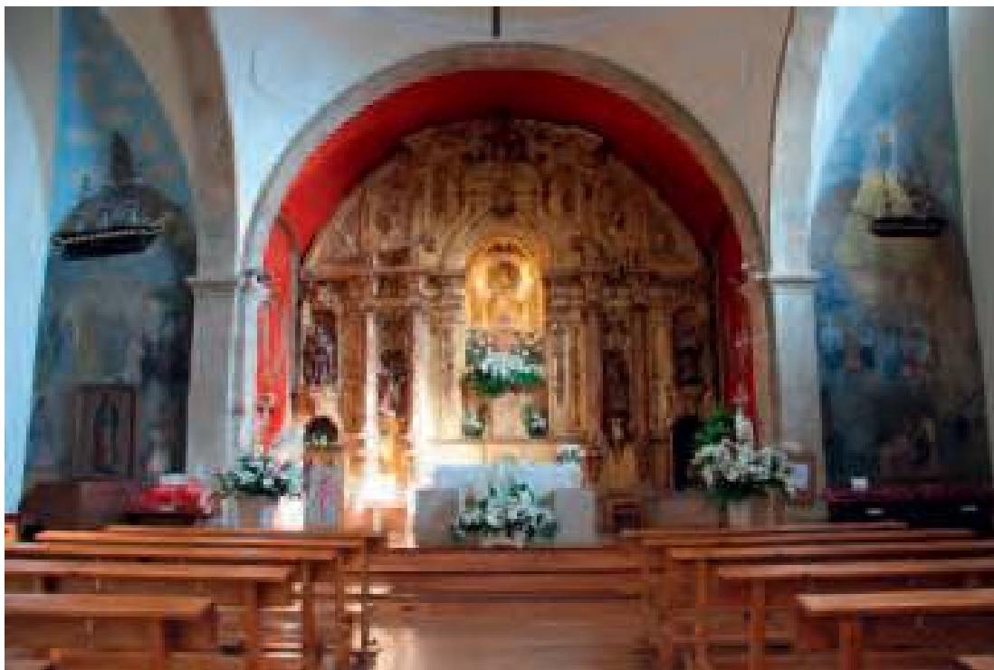
Ermita de Guadalupe, Hondarribia