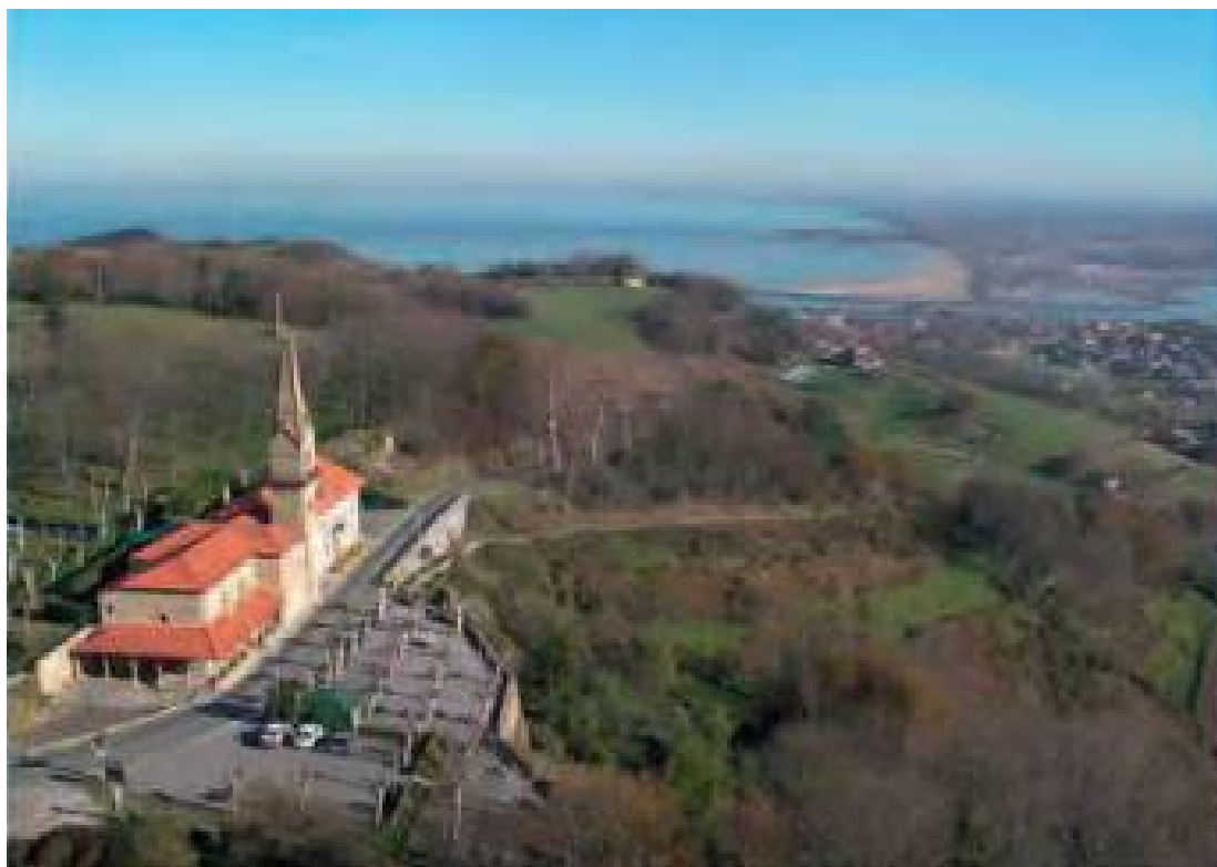
Santuario de Guadalupe, Hondarribia

motivado el exvoto. Sin esta premisa religiosa, el exvoto, como ofrenda, carece de sentido» 1 .