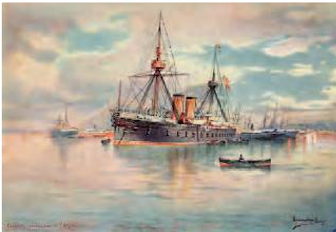
Acuarela de la Vitoria , ya modificada, de Hernández Monjo. Del libro La Armada Española , editado en 1898

Vitoria , con su dotación de 600 almas, se enfrentó a numerosos retos y peligros, participando activamente en la apasionante historia de España. Sirva este humilde estudio como reconocimiento a aquellos marinos, sin duda valientes y abnegados.